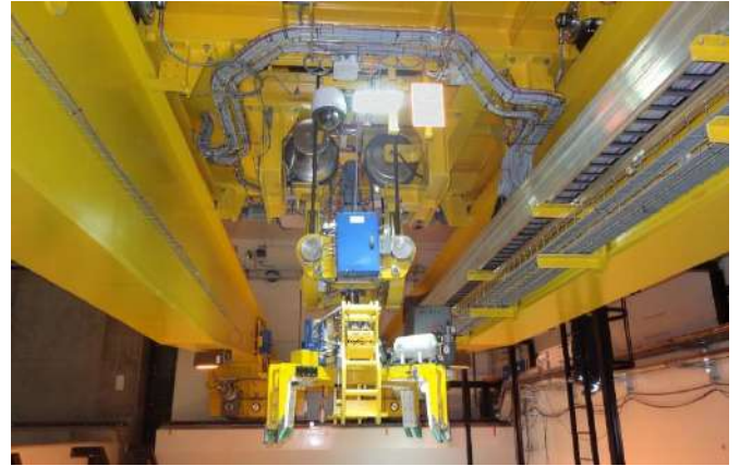
de concevoir des équipements mécaniques pointus