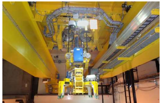
de concevoir des équipements mécaniques pointus