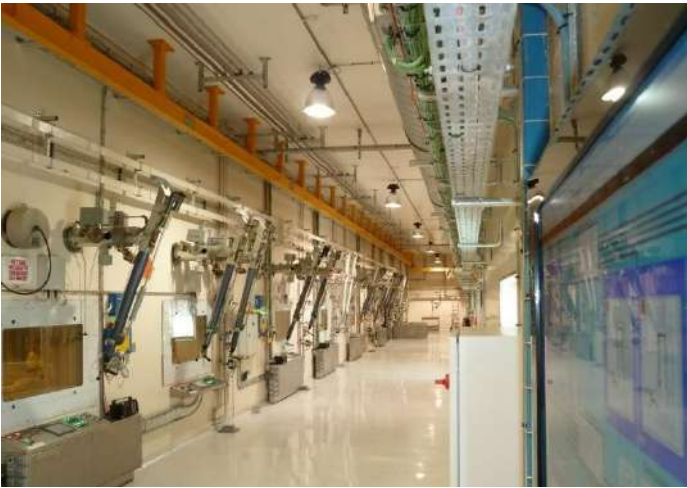
de piloter des projets ensemble de grande envergure