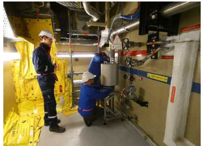
de répondre aux enjeux du parc nucléaire en exploitation