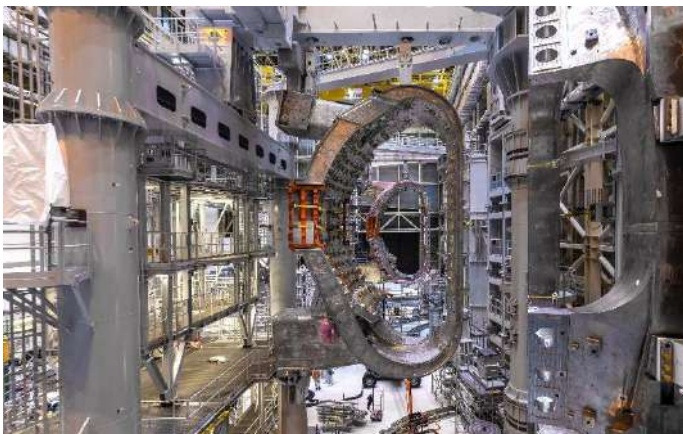
de participer à la construction du projet ITER à Cadarache