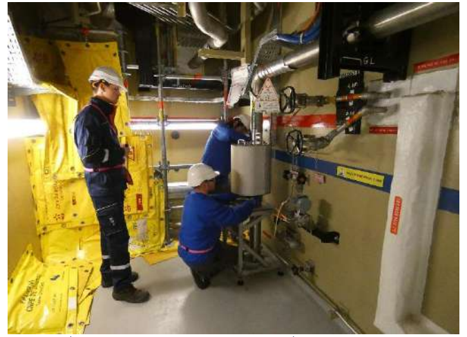
de répondre aux enjeux du parc nucléaire en exploitation